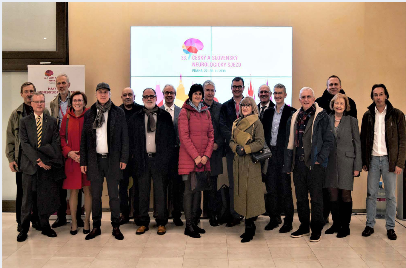
Společné foto s výborem Slovenské neurologické společnosti u příležitosti konání Neurologického sjezdu v Praze 2019.