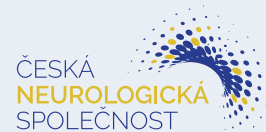
ČESKÁ NEUROLOGICKÁ SPOLEČNOST